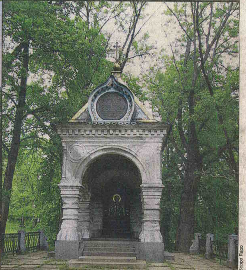
Kirkkojen saarelta. Yhden munkin polku Valamon saarella (kuva ylhäällä vas.) saa karjalaiset herkehtymään. Kirkoistaan kuuluisalla saarella ovat mm. Valamon pääkirkko (ylhäällä oik.), Uuden Jerusalemin skiitta (alhaalla vas.) ja Aleksanteri I:n käynnin kunniaksi rakennettu kappeli.