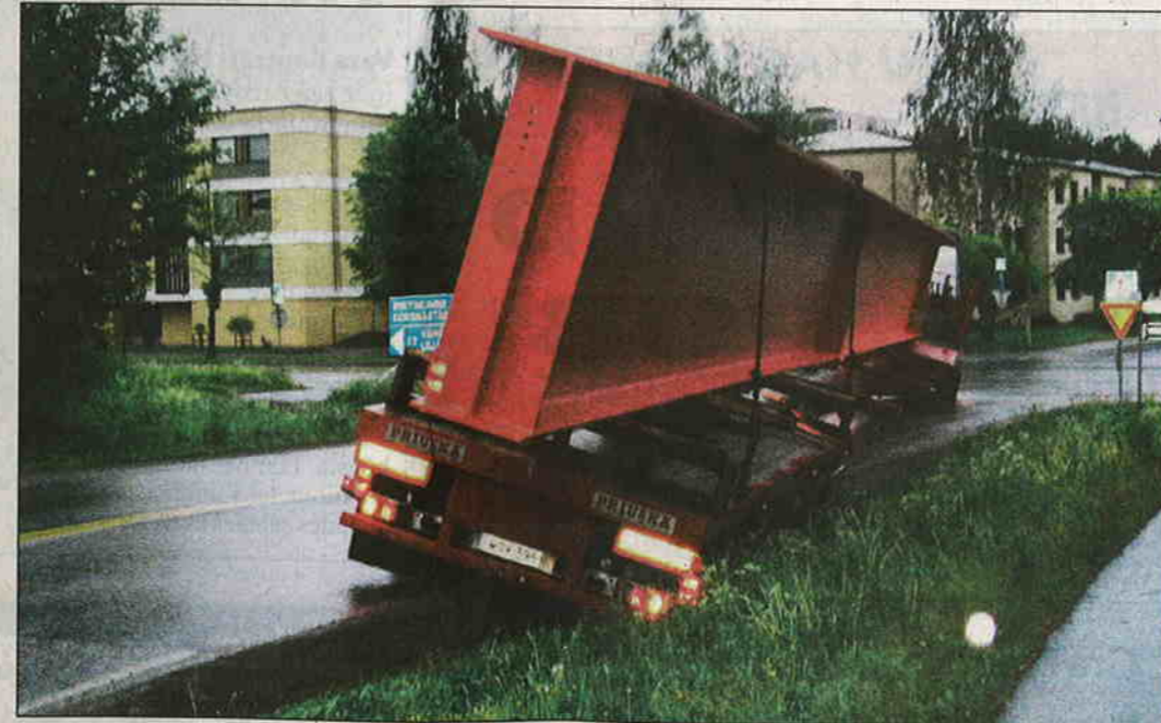
På tisdagskvällen inträffade den här olyckan i korsningen Lumivaaravägen och Gamla Vasagatan.