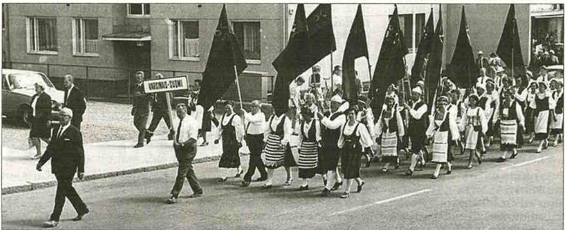
Karjalan Liitto koostuu piireistä ja seuroista. Ne esittäytyvät kesäjuhlilla. Kuva Riihimäen kesäjuhlilta vuonna 1968.