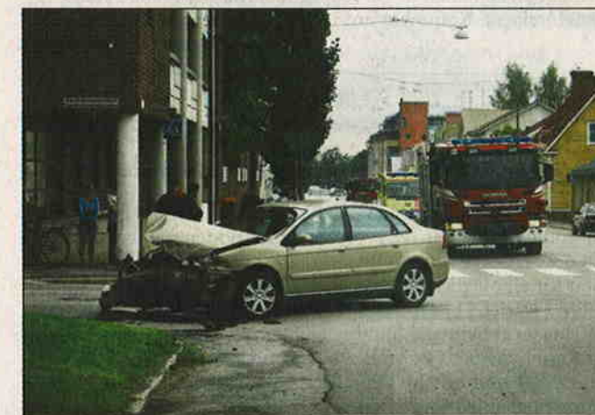
En person fördes till sjukhus efter en krock mellan två bilar på Korsholmsplanen i går.

Kemira har meddelat att bolaget inleder samarbetsförhandlingar som gäller allt som allt omkring 300 anställda. Kemira strävar efter att spara 20 miljoner euro i Finland genom att skära ner antalet personal och koncentrera sin verksamhet. FNB