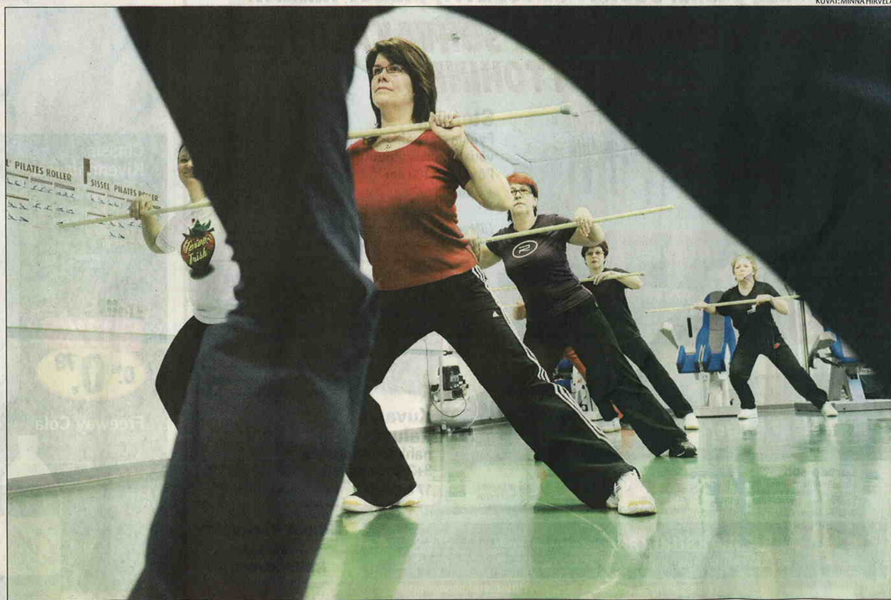
ABB:n pienjännitekojeiden yksikössä alkoi vuoden alussa Sykettä Kojeissa -projekti, jonka tarkoituksena on innostaa työntekijöitä liikkumaan. Yksikkö tarjoaa työntekijöilleen muiden muassa jumppia.

Vuorotyö ei ole este, sillä useita erilaisia jumppia on lähes päivittäin. Lisäksi tarjolla on kuntosalin ohella esimerkiksi palloilulajeja, juoksua, kävelyä, joogaa, pilatesta sekä Botniahallilla toteutettava Terve-Frisk-ohjelma, joka on suunnattu henkilöille, jotka eivät ole aiemmin liikkuneet ollenkaan. Lisäksi on tukitoimintaa laihduttajille ja tupakoivista eroon pyrkiville.